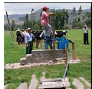
Wasser fürs Vieh in Trujillo