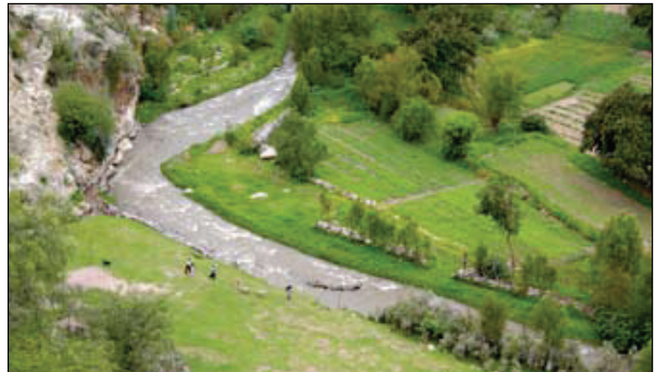
Flusstäler mit einer grossen Nachfrage für die PEP

erstrecken sich weite wüstenartige Regionen. Wenn die Kleinbauern die sandigen Böden bewässern, tragen sie reiche Frucht: vielfältiges Gemüse, Mais, Futterbäume, Spargeln und Beeren. Die bisherigen Pilotprojekte zeigten sehr ermutigende Resultate. W≈3≈W will auf den Erfolgen aufbauen und die Aktivitäten in den Werkstätten von Piura und Trujillo verstärken; denn viele Campesino-Familien benötigen dringend die erfolgreiche Hilfe zur Selbsthilfe von W≈3≈W, damit sie ihre kleinen Bewässerungsvorhaben mit Hilfe der PEP verwirklichen können. Die Pumpen werden auch für die Versorgung von Haushalten und von Viehtränken eingesetzt und resultieren in einer sichtbaren Verbesserung der Lebensqualität dank erhöhter Produktion hochwertiger, besserer Ernährungssicherheit, Reduktion der Verschmutzung des Wassers durch das Vieh, mehr produktiver Arbeit und höherem Einkommen. Einige Fahrstunden von Lima entfernt ist in Mocupe bei Chiclayo eine Werkstatt im Aufbau. Dank der PEP werden dort die Familien nicht mehr in die Grossstadt abwandern müssen. Denn auf ihren Feldern wird neues Leben spriessen.