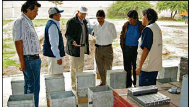
W≈3≈W-Perú und Schweiz stellen Vertretern der Regierung Ayacuuchos die Produktion von 1000 PEPs vor

Das grosse Vorhaben in Ayacucho zur Herstellung und Modellinstallation von PEPs konnte innerhalb eines Jahres realisiert werden. Die Spenden aus der Schweiz dienen der Stärkung unseres Partners W≈3≈W-Perú, womit eine qualitativ hochwertige PEP-Produktion möglich wurde. Die Finanzierung der Materialien und der Werkstatt durch die Regierung von Peru erlaubte es, die umfangreichen Produktionsarbeiten in Rekordzeit zu beenden. Eine grossartige Meisterleistung von W≈3≈W-Perú! Nach der Installation von Modellpumpen bei Bauern, die von Schweizern mitgetragen wurde, hat die Regierung in Ayacucho nun die wichtige Aufgabe, die hochwertigen PEPs bei Campesinos effizient in Einsatz zu bringen. W≈3≈W bleibt dran.