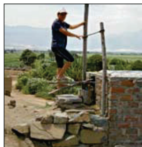
Wasser für Haushalte in Chiclayo